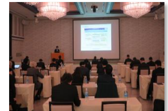
やまなし企業支援ネットワーク会議