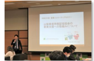
当協会主催の創業フォローアップセミナー