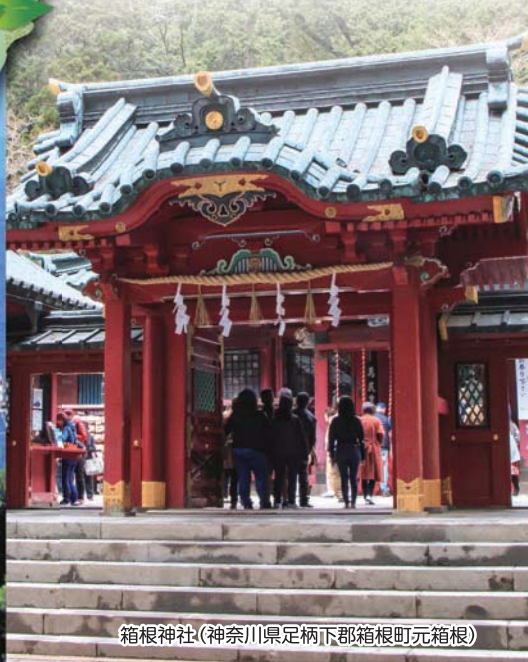
箱根神社(神奈川県足柄下郡箱根町元箱根)