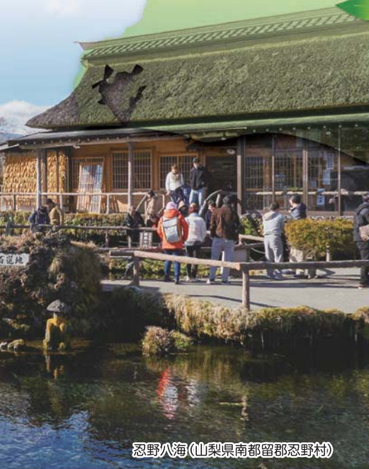
忍野八海(山梨県南都留郡忍野村)

富士箱根伊豆地域の神に仕える巫女。 地域の観光を応援するため、 各地域の名所を巡りながら、 祈りを捧げている。