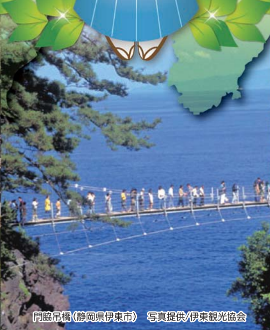
門脇吊橋(静岡県伊東市)